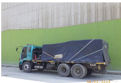
รูปที่ 2-13 ผ้าใบปิดคลุมรถขณะขนส่งแร่