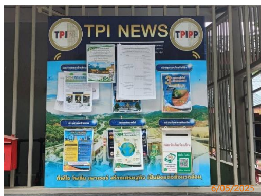
ศาลาประชาคม หมู่ 4 ต.มิตรภาพ