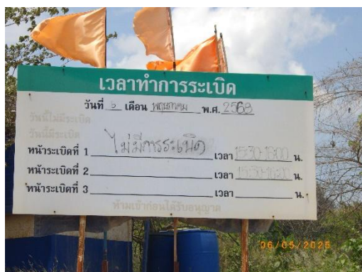
รูปที่ 2-6 ป้ายแจ้งวัน-เวลาระเบิด

ของบริษัท ทีพีโอ โพลีน จำกัด (มหาชน) ระหว่างเดือนมกราคม-มิถุนายน พ.ศ. 2568