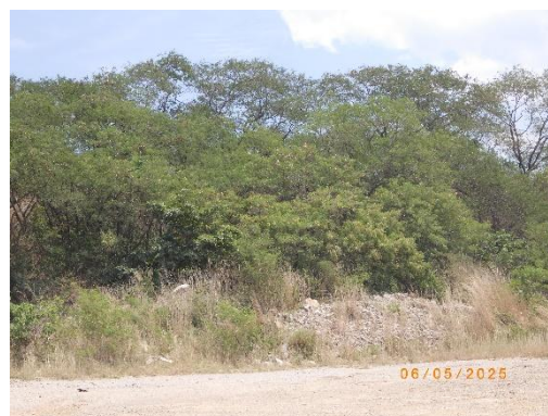
รูปที่ 2-9 แนวต้นไม้ ในแนวเขตเว้นการทำเหมือง