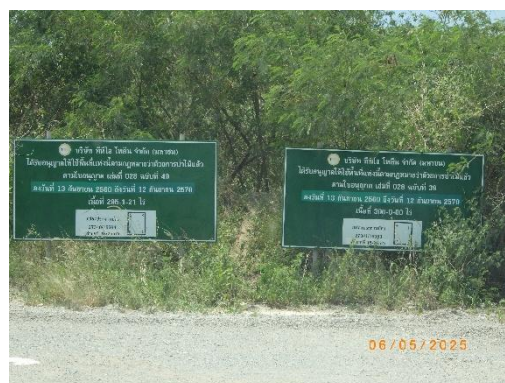
รูปที่ 2-7 ป้ายแสดงแนวขอบเขตการทำเหมือง