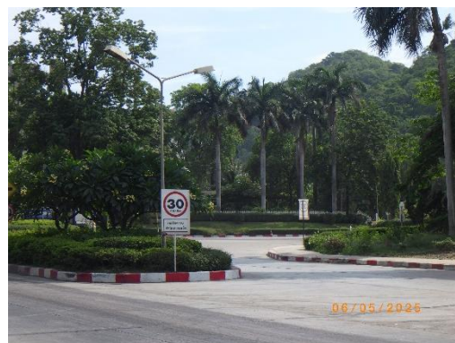
รูปที่ 2-24 ป้ายควบคุมความเร็วบริเวณพื้นที่โครงการ