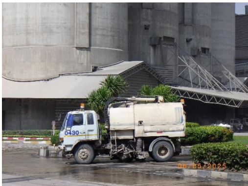
รูปที่ 2-31 รถดูดฝุ่นทำความสะอาดฝุ่น บริเวณพื้นที่โครงการ