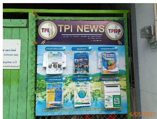
ศาลาประชาคม หมู่ 10 ต.มิตรภาพ