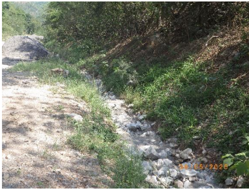
รูปที่ 2-39 คูระบายน้ำ บริเวณพื้นที่โครงการ

ของบริษัท ทีพีโอ โพลิน จำกัด (มหาชน) ระหว่างเดือนมกราคม-มิถุนายน พ.ศ. 2568