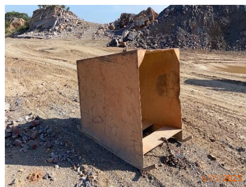
รูปที่ 2-5 ที่กำบังในการหลบขณะระเบิด