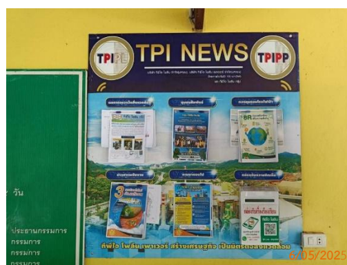
บ้านผู้ใหญ่ หมู่ 10 ต.ทับกวาง ที่ทำการผู้ใหญ่บ้าน ม.10