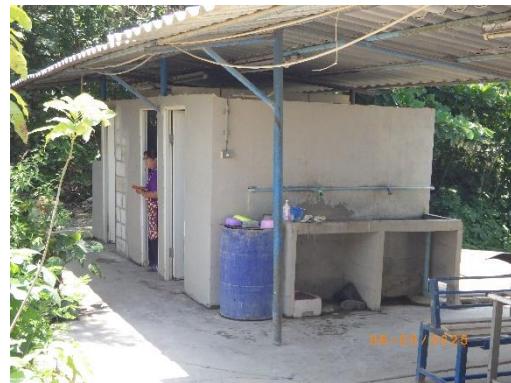
รูปที่ 2-17 ห้องน้ำภายในบริเวณโครงการ