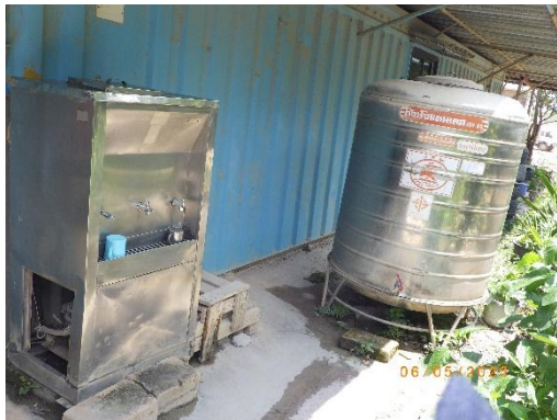
รูปที่ 2-16 ถังสำรองน้ำดื่มในพื้นที่สำนักงาน

ของบริษัท ทีพีโอ โพลีน จำกัด (มหาชน) ระหว่างเดือนมกราคม-มิถุนายน พ.ศ. 2568