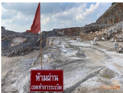
รูปที่ 2-4 ธงแสดงตำแหน่งหลุมเจาะ