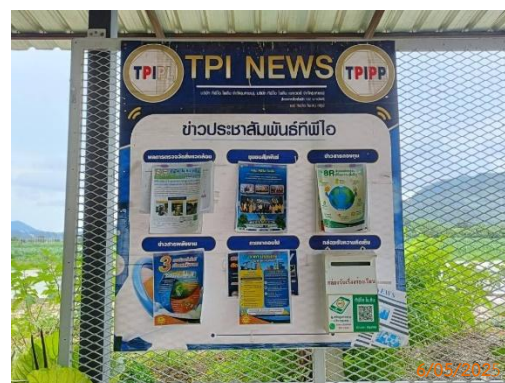
บ้านผู้ใหญ่ หมู่ 3 ต.ทับกาง ที่ทำการผู้ใหญ่บ้าน ม.3