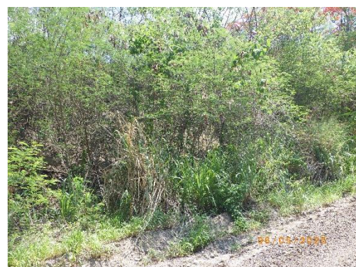
รูปที่ 2-44 ไม้คลุมดินบริเวณพื้นที่โครงการ