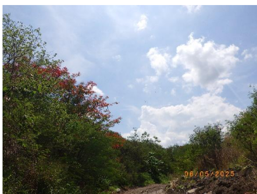
รูปที่ 2-25 ปลุกไม้ยืนต้นโตเร็วประจำถิ่นเพิ่มเติม