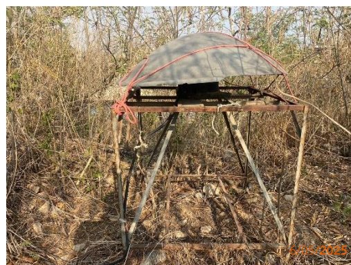
รูปที่ 2-3 สัญญาณเตือนก่อนทำการระเบิด