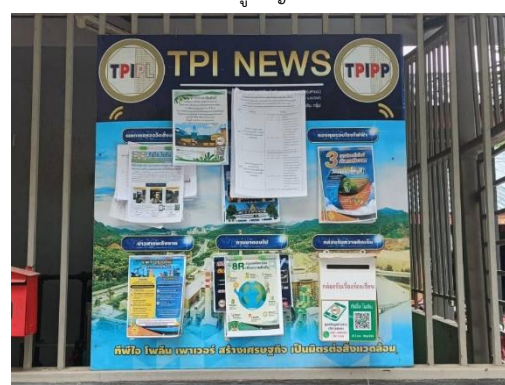
ศาลาประชาคม หมู่ 6 ต.มิตรภาพ