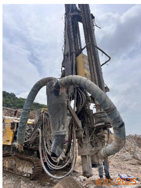
รูปที่ 2-11 เครื่องเจาะรื้อระเบิด ที่มีระบบ Cyclone และถุงกรอง

ของบริษัท ทีพีโอ โพลีน จำกัด (มหาชน) ระหว่างเดือนมกราคม-มิถุนายน พ.ศ. 2568