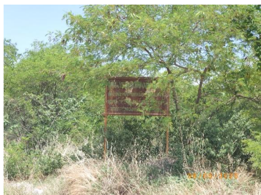
รูปที่ 2-10 โครงการฟื้นฟูเหมือง (ในแนวเขตเว้นการทำเหมือง)