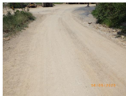
รูปที่ 2-42 การเก็บกวาดเศษหินและเศษดิน บริเวณด้านบนของหน้าระเบิด