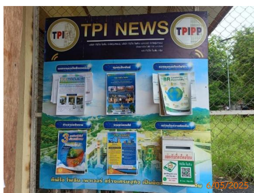
ศาลาประชคม หมู่ 5 ต.มิตรภาพ