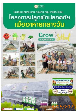
รูปที่ 2-41 สนับสนุนกิจกรรม ภายในโรงเรียนบ้านซับบอน