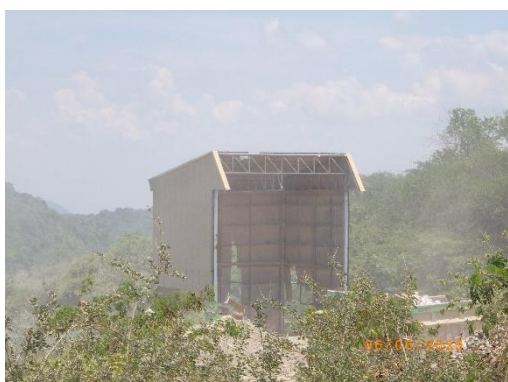
รูปที่ 2-27 เครื่องย่อยหินปูน (Limestone Crusher)