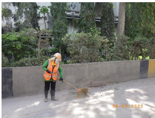
รูปที่ 2-35 พนักงานทำความสะอาดลานซีเมนต์ บริเวณโรงงานปูนซีเมนต์

ของบริษัท ทีพีโอ โพลีน จำกัด (มหาชน) ระหว่างเดือนมกราคม-มิถุนายน พ.ศ. 2568