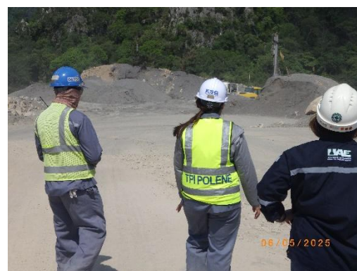
รูปที่ 2-26 การติดตามตรวจสอบตามมาตรการป้องกันและแก้ไขผลกระทบสิ่งแวดล้อม