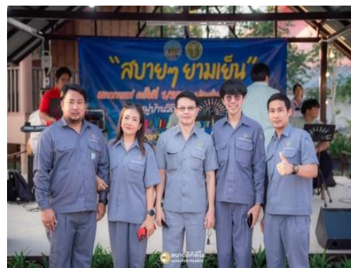
รูปที่ 2-22 (ต่อ) สนับสนุนกิจกรรมชุมชน