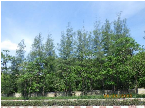
รูปที่ 2-29 ปุ่มไม้ยืนต้นขนาดใหญ่ บริเวณขอบเขตพื้นที่โครงการที่ต่อเนื่องกับ โรงเรียนบ้านชัยบอน

ของบริษัท ทีพีโอ โพลีน จำกัด (มหาชน) ระหว่างเดือนมกราคม-มิถุนายน พ.ศ. 2568