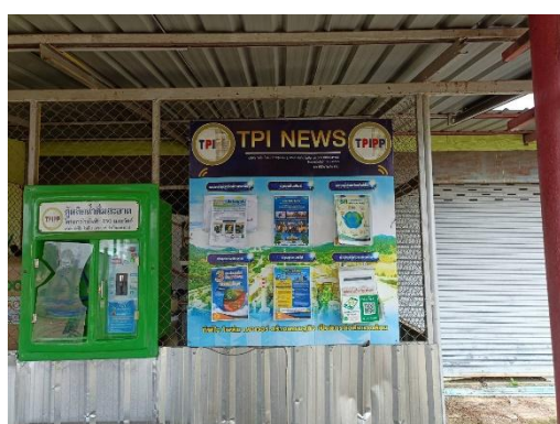
วัดท่าเสาหมู่ 13 ต.มวกเหล็ก วัดท่าเสา