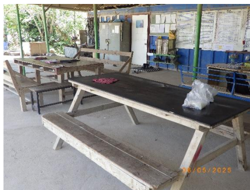
รูปที่ 2-20 บริเวณพักผ่อนสำหรับพนักงาน