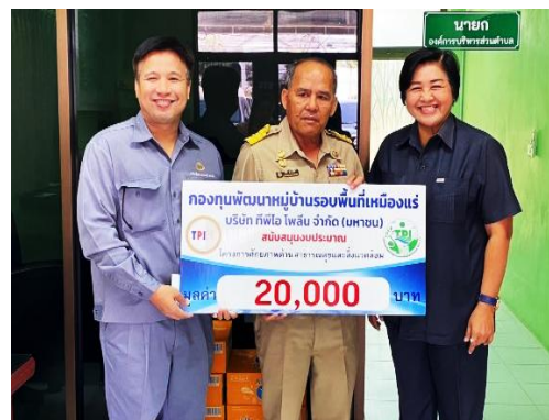
รูปที่ 2-22 สนับสนุนกิจกรรมชุมชน