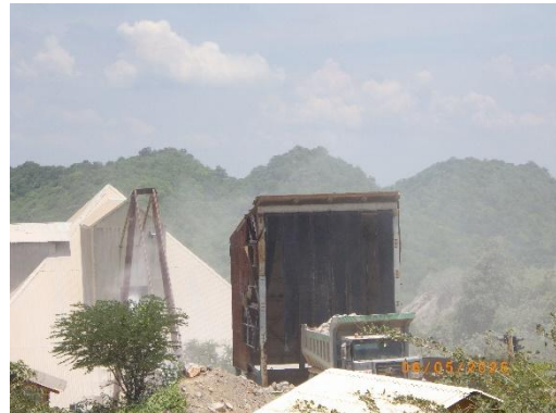
รูปที่ 2-30 เครื่องฉีดพ่นน้ำในลักษณะของม่านน้ำ บริเวณลานกองวัตถุดิบ