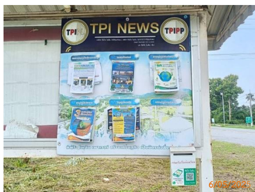
สายตรวจทับกาง หมู่ 9 ต.ทับกาง สายตรวจทับกาง

ของบริษัท ทีพีโอ โพลีน จำกัด (มหาชน) ระหว่างเดือนมกราคม-มิถุนายน พ.ศ. 2568