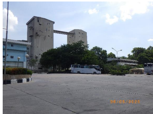
รูปที่ 2-32 ถนนคอนกรีตเสริมเหล็ก บริเวณเส้นทางขนส่งหลัก