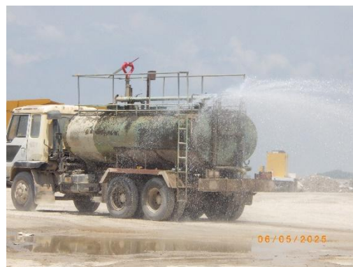
รูปที่ 2-12 การฉีดพรมน้ำบริเวณเส้นทางขนส่งแร่