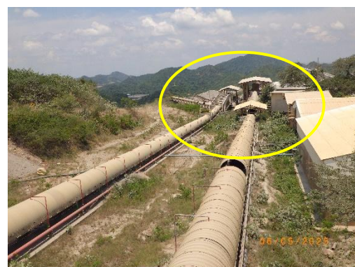
รูปที่ 2-28 ระบบ Bag Filter จุดถ่ายโอนต่างๆของสายพานลำเลียง