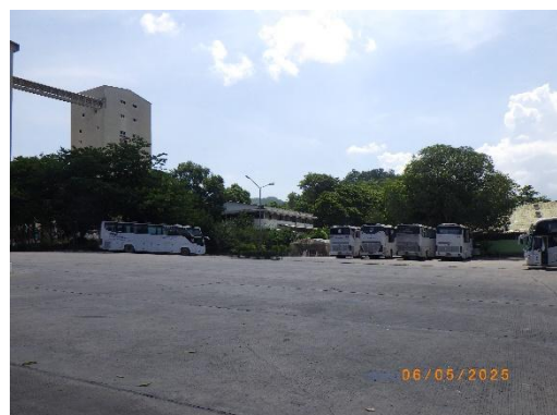
รูปที่ 2-34 ลานจอดรถบรรทุก บริเวณโรงงานปูนซีเมนต์