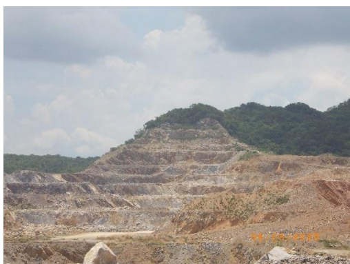
รูปที่ 2-2 ลักษณะการทำเหมืองแบบขั้นบันได เหมืองแร่หินปูน