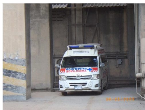
รูปที่ 2-15 ห้องพยาบาลและรถพยาบาลฉุกเฉิน