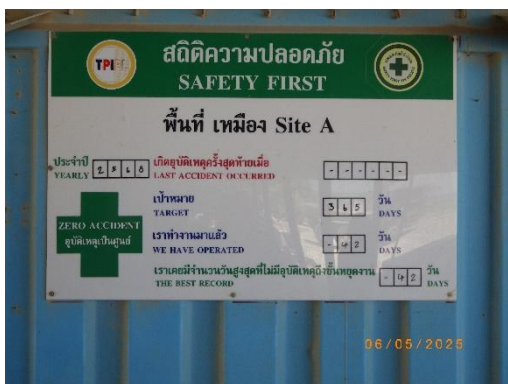
รูปที่ 2-18 ประกาศด้านความปลอดภัย ในพื้นที่เหมือง