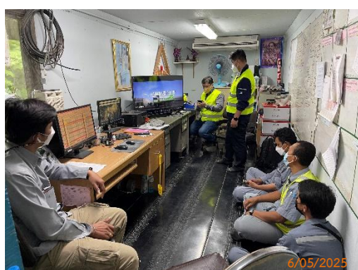
รูปที่ 2-37 การอบรมวิธีการทำงาน ของเครื่องจักรกลและอุปกรณ์แต่ละประเภท ให้แก่พนักงาน