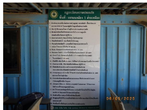
รูปที่ 2-19 ประกาศข่าวสารในพื้นที่เหมือง