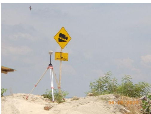
รูปที่ 2-43 ป้ายชะลอความเร็ว