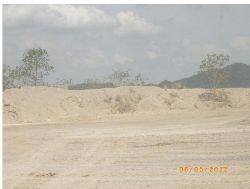
รูปที่ 2-23 ใช้ประโยชน์มูลดินในการปรับปรุงไหล่ทาง และเส้นทางบริเวณหน้าเหมือง