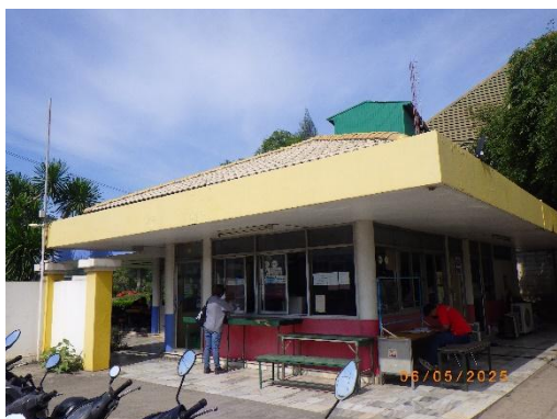
รูปที่ 2-21 อาคารติดต่อและรับเรื่องร้องทุกข์ ของบริษัทฯ

ของบริษัท ทีพีโอ โพลีน จำกัด (มหาชน) ระหว่างเดือนมกราคม-มิถุนายน พ.ศ. 2568