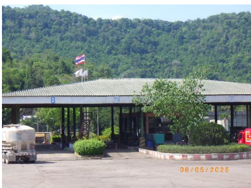
รูปที่ 2-33 เครื่องชั่งน้ำหนัก บริเวณประตูที่ 3