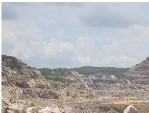
รูปที่ 2-1 สภาพหน้าเหมืองแร่หินปูน