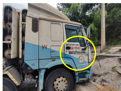
รูปที่ 2-38 เบอร์โทรศัพท์ หรือรายละเอียด ที่สามารถแจ้งข้อร้องเรียนที่เห็นชัดเจน ข้างรถบรรทุกแร่ของโครงการ