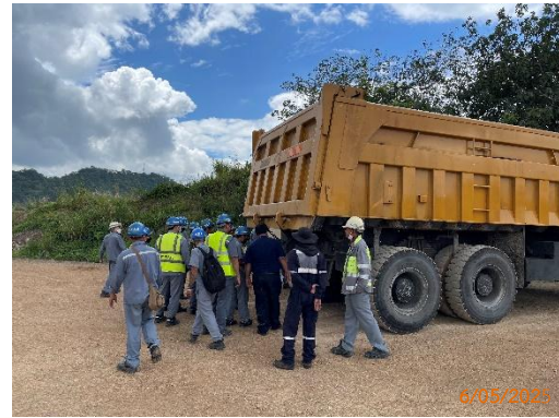
รูปที่ 2-40 การอบรมพนักงานขับรถบรรทุกแร่