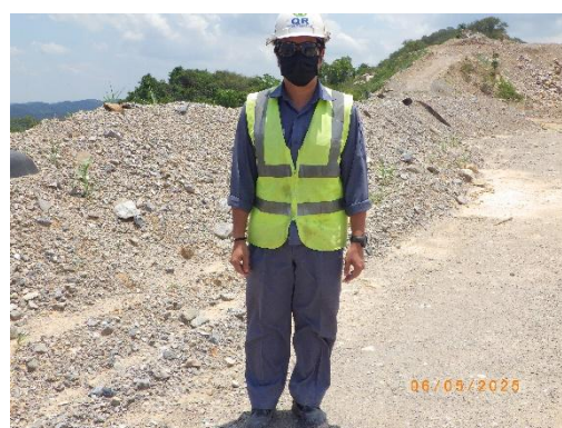
รูปที่ 2-14 การสวมใส่อุปกรณ์ป้องกันอันตราย ส่วนบุคคลของพนักงาน